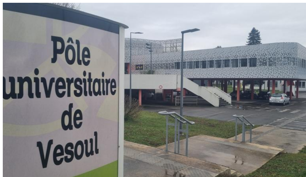
Les cours auront lieu en présentiel sur le site du pôle universitaire de Vesoul, à Vaire-et-Montoille.

Elle est susceptible d'intéresser les responsables RH (ressources humaines), managers, cadres, dirigeants, préventeurs, consultants, professionnels HSE et salariés