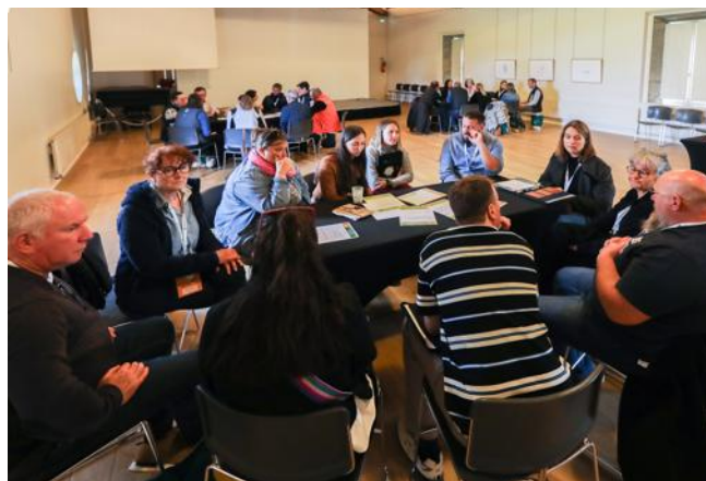
Le dixième congrès national du service de remplacement agricole se déroule pendant trois jours à la Saline royale d'Arc-et-Senans.