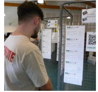
Des offres seront disponibles sur place.

Il sera possible d'obtenir la carte Avantages Jeunes, offerte aux jeunes de moins de 30 ans résidant à Héricourt et dans les